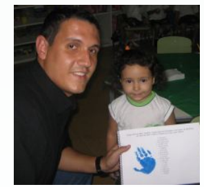
Mas também valeu o autógrafo com a mãozinha, para alegria do papai.