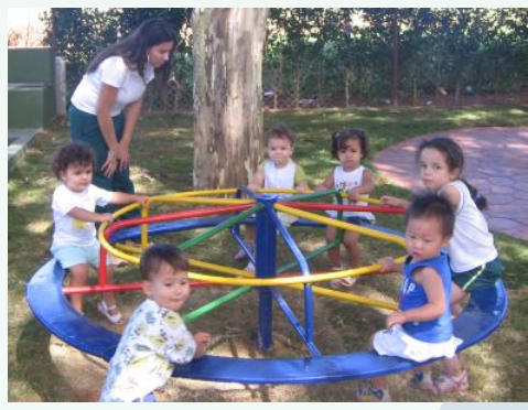
As crianças estão de volta ao parque da escola, agora preparado para oferecer o melhor em termos de lazer e esporte.

Com a conclusão das obras de infra-estrutura do complexo de esporte e lazer da escola DNA, foi iniciada a parceria com a Pró-Atividade, uma empresa especializada na formatação, implantação, recrutamento e gestão técnica na área do desporto escolar em Brasília, e que busca definir dentro do ambiente escolar uma nova visão do esporte como fator de transformação social, que melhore os indicadores sociais e o índice de desenvolvimento humano.