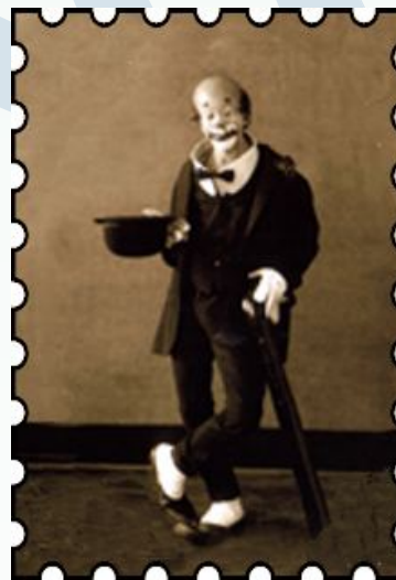
Piolin, o "Rei dos Palhaços".