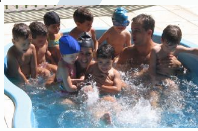
A primeira aula de natação (na piscina quentinha a 29 graus) é uma experiência alegre e motivadora.

Em uma primeira etapa, serão implantadas as atividades de natação, hidroginástica, ballet e futebol de salão. De acordo com a demanda, serão oferecidas, progressivamente, as seguintes atividades: basquetebol, voleibol, handebol, dentro das modalidades disputadas em quadras; além destas serão disponibilizadas ainda as seguintes modalidades, como caratê, capoeira, tênis de mesa, xadrez; e no plano artístico, alunos e comunidade contarão com aulas de ballet clássico, jazz e dança de salão; haverá também a oferta de aulas de violão e flauta doce, expressão corporal, teatro pintura e desenho, a