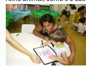
Quem sabia autografar assinou o livro.