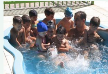
Aquababy faz a festa dos futuros nadadores.

Caso um aluno sofra uma crise de bronquite asmática é aconselhável não frequentar a piscina, pois a tendência a tossir e cuspir na água não é adequada aos padrões de higiene coletiva. O mesmo procedimento deve ser adotado para os alunos em crise asmática.