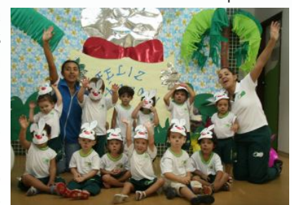
... aos maiores...