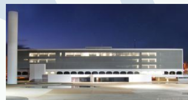
Biblioteca Nacional de Brasília.

As crianças visitarão o novo Complexo Cultural da República (Museu Honestino Guimarães e Biblioteca Nacional de Brasília) e curtirão um espetáculo de teatro intitulado "As Três Cores do Brasil", cuja peça conta a origem do povo brasileiro. Haverá também um show musical "O Brasil que Canta e Encanta". Ao final da programação, as crianças farão um lanche bem caprichado no Parque da Cidade.