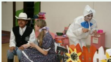
... que teve teatrinho para falar de amizade, amor e partilha.