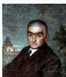
Retrato a óleo de Monteiro Lobato.

Entre os objetivos principais do projeto constam a delimitação do que é a identidade brasileira, seus elementos, bem como de que maneira esta identidade foi formada, proporcionando aos alunos a identificação de suas próprias origens.