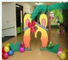
... todos curtiram a festa da Páscoa...