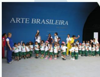
Durante o passeio a primeira parada foi na exposição de arte brasileira...

que causou uma forte impressão na garotada, que elogiou bastante a beleza e a fartura de cores.