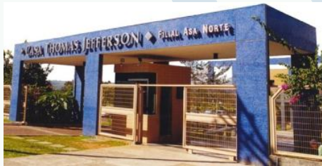
Fachada da Thomas Jefferson, unidade da Asa Norte.