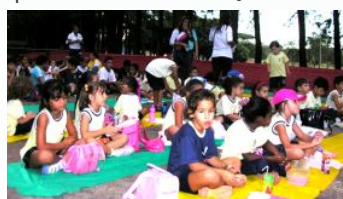
...E um super lanche no parque da cidade...

A outra parada, e mais curtida pela meninada, foi na Biblioteca Nacional Leonel de Moura Brizola, onde foi encenada a peça "As 3 cores do Brasil", apresentada pelo grupo Daqui, Dali, Dacolá, uma excelente trupe de contadores de histórias, aqui de Brasília, que falou sobre a formação cultural do Brasil com muita música e percussão, conseguindo prender a atenção da garotada por mais de uma hora.