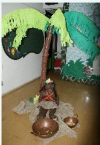
Brincadeiras, artesanato e muita criatividade...

O mês de abril na escola DNA foi totalmente dedicado ao Brasil e aos brasileiros.