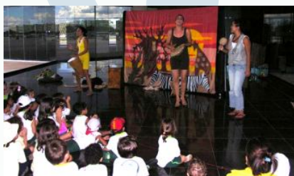
... depois teatrinho e música...

Para fechar o dia em grande estilo, nada melhor que um delicioso lanche no parque da cidade, ao som de uma banda executando músicas de Vinícius de Moraes. Esse passeio valeu a pena!