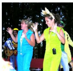
... com direito a mais um show e música. Eta passeio bom!