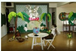
...Ao mesmo tempo em que aprendemos sobre a formação da identidade brasileira.

As crianças e os professores, de todas as séries, participaram alegremente das atividades propostas, que incluíram produção de artesanato com materiais naturais e recicláveis, teatro de marionetes e trabalhos em classe que abordaram desde a chegada dos portugueses em terras brasileiras, até a formação da identidade nacional, composta pela miscigenação étnica e cultural das raças que compõem este lindo mosaico brasileiro.