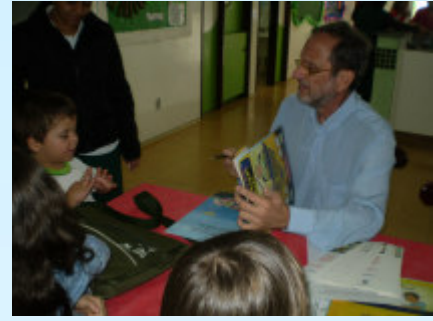
Hora do autógrafo

Logo após a contação das histórias, os escritores, encantados com a receptividade dos alunos, procederam a uma grande sessão de autógrafos e fotografias junto aos seus mais novos fãs. A literatura agradece.