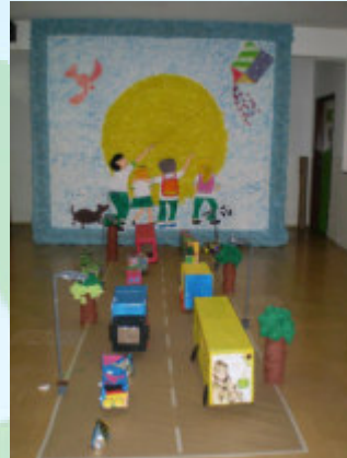
Trabalho feito pelos alunos sobre o livro Quer Conhecer minha rua?